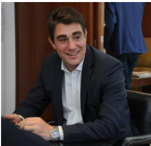
JAVIER IGUACEL Secretario de Energía de la Nación