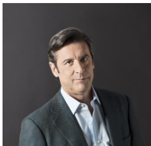
CARLOS MAGARIÑOS Embajador de la República Argentina en la República Federativa de Brasil